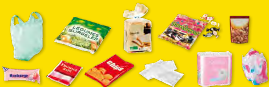
tous les sacs et sachets et tous les films