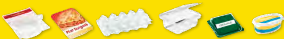
toutes les barquettes