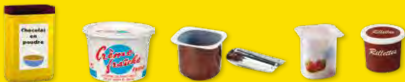
tous les pots et boîtes